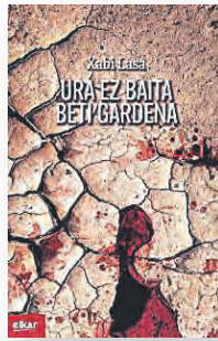
'URA EZ BAITA BETI GARDENA' Idazlea: Xabi Lasa. Argitaletxea: Elkar.

Nafarroako Erriberan, Bardeako atarian kokatutako Lurribar herrira garamatza istorioak. Karduga urmaela eta haren inguruko xextrak dira abiapuntua, ura elkarren artean banatzeko arazoak baitituzte landa zabalak lantzen dituzten nekazariak eta herritarren beharrak ase nahi dituen udalak. Liskarrak konpontzera joaten da