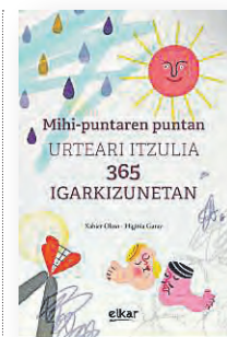
'MIHI-PUNTAREN PUNTAN' Idazlea: Xabier Olaso. Ilustratzailea: Higinia Garai. Argitaletxea: Elkar.

zun jolasak dira liburu honen ardatz, eta taldeak dinamizatzea helburu. Ukatu gabe liburua bakarka erabilita berdin dela gozamen iturri, antzematen zaio jolas kolektibo bilatzen duela, argien antzeman ere Jolasean igartzeko azken atalean dagoen proposamen parean.