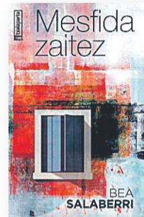
'MESFIDA ZAITEZ' Egilea: Bea Salaberri. Argitaletxea: Txalaparta.

Euskal Herriko nazio gatazkaren bi une gako ditu testuingurutzat istorioak. Liburuaren lehen zatia Lizarra-Garaziko akordioaren ostean abiatzen da, eta, milurtekoa igarota, 2000ko hamarkadako lehen urteetako militantzia politikoak, poliziaen sarekadek,