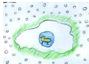
Ane Bobadilla Lasarteko Landaberri ikastola