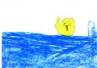
Igor Ugarte Gareseko eskola