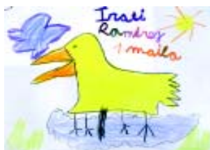
Irati Ramirez Aguraingo Pedro Lope de Larrea ikastola