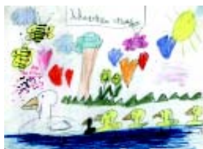
Olaia Arakolain Tolosako Laskorain ikastola