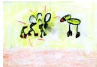
Maria San Roman Gareseko eskola