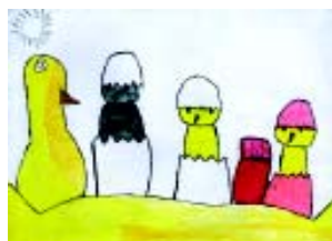
Iker Berakoetxea Tolosako Laskorain ikastola