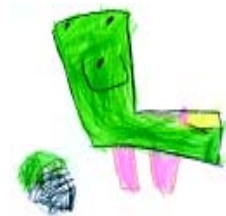
Jone Toña Artziniegako udal liburutegia