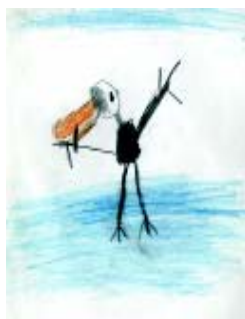
Aitor 6 urte Tolosako Laskorain ikastola