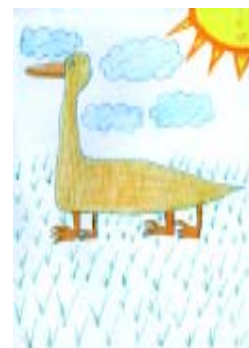
Jon Bombin Duranako Ikasbidea ikastola